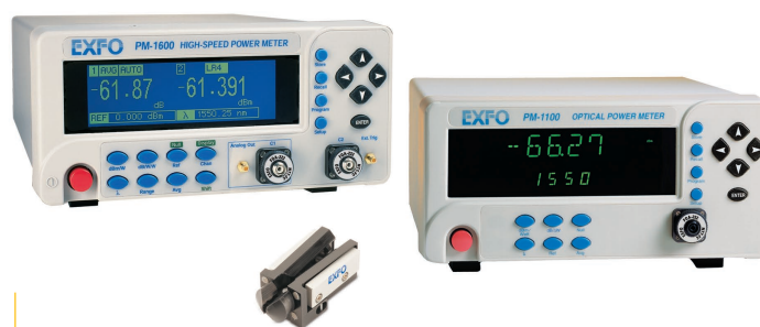
测试非连接器连接元件时，将 BFA-3000 通用裸光纤适配器与 PM-1600W 高速功率计一同使用，并确保可重复测量。

在 750 到 1700 nm 波长范围内测量高功率（最高 20 dBm）时，选择 PM-1100。该检测器的灵敏度为 -75 dBm。