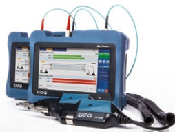
MaxTester 940 Certificatore fibra OLTS