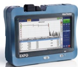
MaxTester 700B Serie OTDR