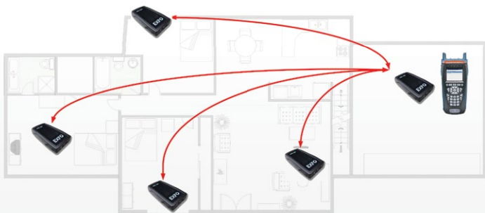
为 HPNA 部署预鉴定同轴环境。