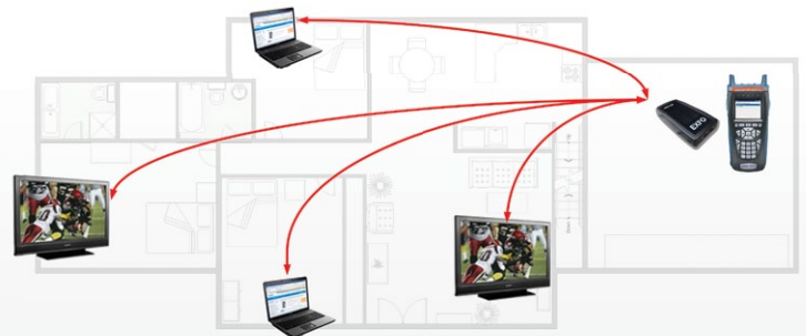
对现有 HPNA (同轴) 环境进行故障诊断。