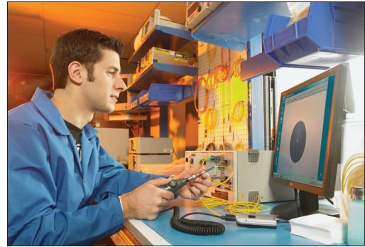
Überprüfung von Patchkabeln in der Produktion