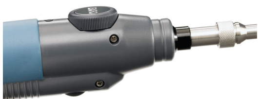
Einstellbare Vergrößerung und Bildscharfe