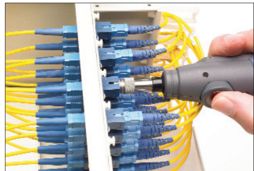
Überprüfung der Einbaukupplungen in Patchfeldern