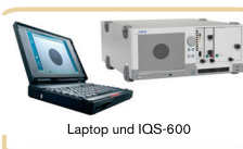
Laptop und IQS-600