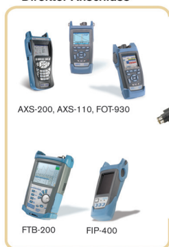
AXS-200, AXS-110, FOT-930