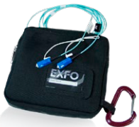
Fibre de lancement EF (SPSB-EF-C30)

Qu'il s'agisse d'entreprises en expansion ou de centres de données à grand volume, les nouveaux réseaux de données à haut débit construits avec des fibres multimodes sont soumis à des tolérances plus strictes que jamais. En cas de défaillance, des outils de test intelligents et précis sont nécessaires pour trouver et réparer rapidement le défaut.