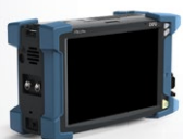
平台 FTB-2/FTB-2 Pro