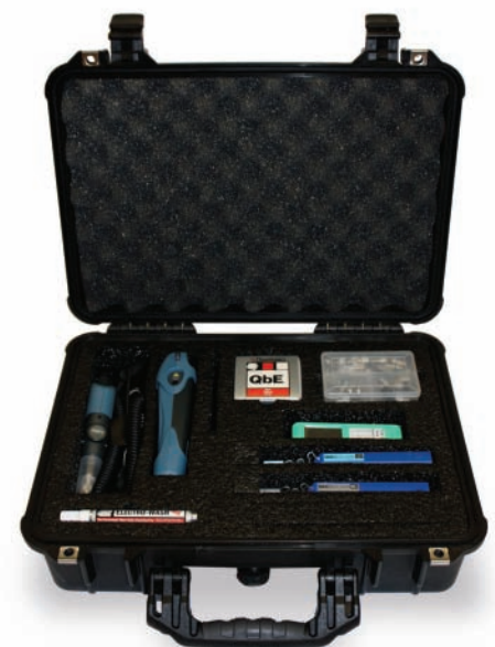
■ Trousse de nettoyage de luxe