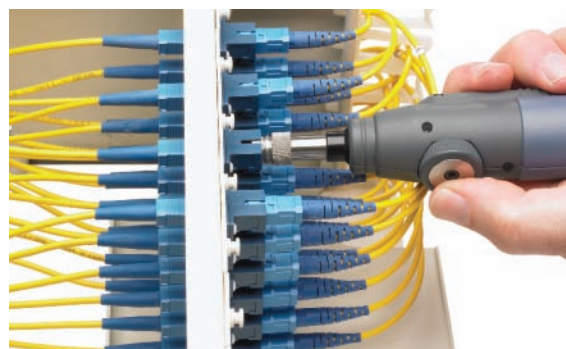
Inspection d'un connecteur dans un panneau de répartition